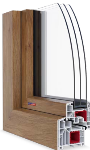
PASIV CL hliníkový klip v laminaci Winchester