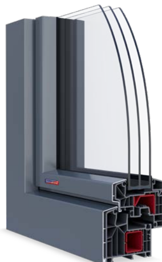
PASIV HL hliníkový klip RAL 7012 a vnitřní laminace Břidlicová šedá

POZNÁMKA: Zvolené okno si můžete přizpůsobit doplňky dle vlastního výběru.