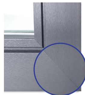
Designový svar V-Perfect