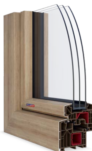
PASIV HL oboustranná laminace Woodec Turner Oak Malt