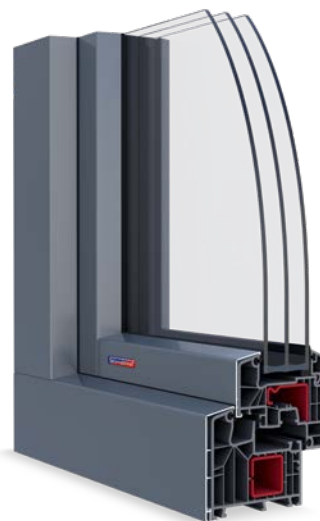
hliníkový klip RAL 7012 a vnitřní laminace Břidlicová šedá