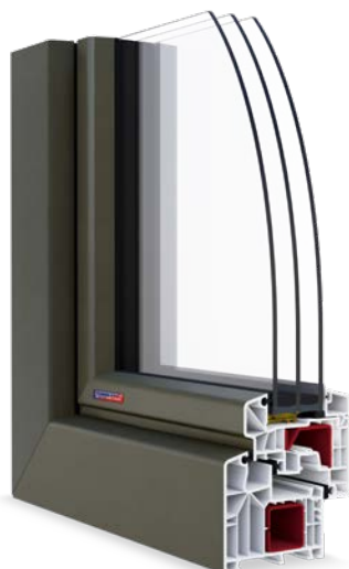
PASIV HL laminace Flemish Gold