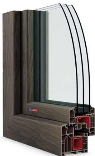
PASIV CL laminace Woodec Turner Oak Toffee